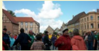
An der Knatter? Oder wo?